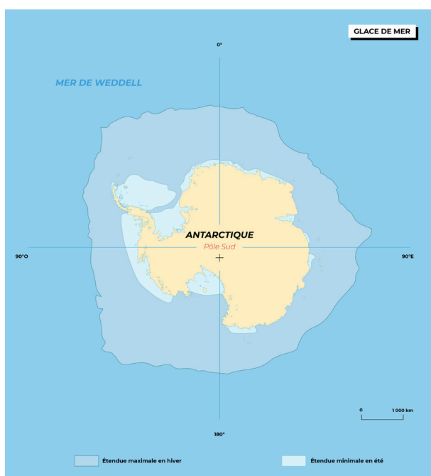
La "pulsation" annuelle de la banquise.